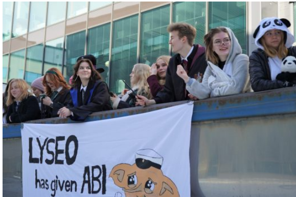
Figure 1: 22