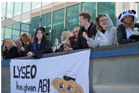
Figure 1: 21