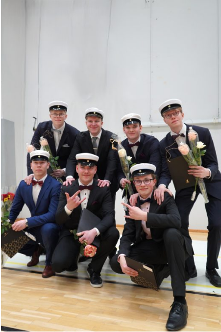
Kuva 1: 1